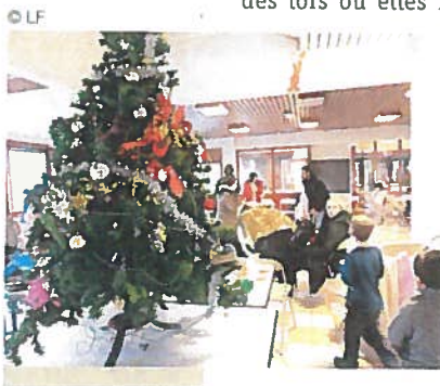
Fêter Noël est aussi une coutume festive et intégrative.

rituels en les partageant avec ses voisins appartenant à une autre tradition permet de se retrouver, au-delà des particularismes, autour d'une même humanité. Organiser une soirée en accueil collectif de mineurs pour ces occasions n'a rien de choquant, dès lors où elles ne sont pas utilisées